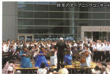
昨年のオープニングコンサート

一流アーティストや地域の音楽愛好家たちが、市内各所やさくらホールで素敵な音楽をお届けします。