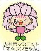
大村市マスコット「オムランちゃん」