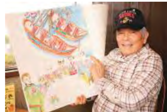
編集 / 藤本 明宏

長岡：何歳になってもアイデアは尽きませんね。これからも体にお気をつけて、お互い頑張りましょう。今日はお忙しい中、ありがとうございます。