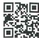
田中鎌工業のホームページはコチラ

1962年12月15日に田中鎌工業の長男として生まれる。日本大学工学部機械科を中退し、1983年に田中鎌工業有限会社入社。現在は田中鎌工業有限会社の代表取締役を務めるほか松原保育園保護者会会長や大村市立松原幼稚園保護者会会長、大村市松原小学校育友会会長、長崎日本大学中学・高等学校育友会副会長を歴任。また、(社)大村青年会議所に所属し、これまでおおむら夏越まつり委員長など14年間活動していた。趣味はたまにいくゴルフ。