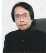
西村 朗 (プログラミング・トーク)

【出演】迫昭嘉(ピアノ)、松原勝也(コンサートマスター)、長崎OMURA室内合奏団 【ゲスト】西村朗(プログラミング・トーク) 【プログラム】ベートーヴェン/序曲「コリオラン」Op.62 ベートーヴェン/ピアノ協奏曲第5番 変ホ長調 Op.73「皇帝」 ベートーヴェン/交響曲第7番 長調 Op.92