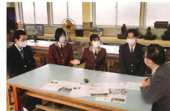
編集 / 藤本 明宏

長岡：それぞれ貴重な経験をされていますね。進路もさまざまだと思いますが、きっとどの学校や職場でも活躍できるはずですよ。明るく個性あふれる未来となるよう私も願っています。今日は楽しいひと時をありがとうございました。