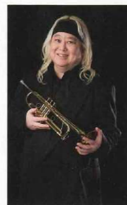
エリック・ミヤシロ