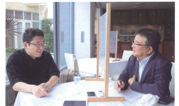
編集 / 藤本 明宏

長岡：これからもいろんな形でのお世話になります。今日はお忙しい中、貴重なお話をありがとうございました。