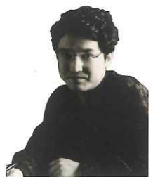
日高 哲英(ひだか てつひで) 作曲家 / 指揮者 / 編曲家

作・編曲家。東京音楽大学作曲科卒業後、同大学院修士課程を修了。作曲を西村朗、指揮を三石精一、尺八を横山勝也に師事。演劇やオーディオ(ラジオ)ドラマ、コンサート作品、NHK「名曲アルバム」など、幅広い作品の音楽を手がけている。演劇作品としては、俳優座「正義の人々」や、劇団民藝「かの子かんのん」、青年座「天一坊十六番」、無名塾「長州異聞」などに携わり、オーディオドラマの新日曜名作座「エドの舞踏会」やNHK青春アドベンチャー「白狐魔記」なども担当。その他の作品として、映画の「ネムリユスリカ」、「夏の祈り」、オペラの「美しきまほろば〜ヤマトタケル」、尺八の四重奏曲第1〜11番など。長崎OMURA室内合奏団とは、市民ミュージカル「思い出の洋楽」コンサートなどの指揮・編曲として共演多数。