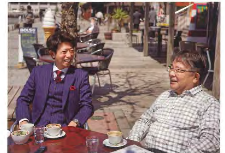
取材場所：Delicious Restaurant アディックコーヒーセカンド (長崎出島ワフ1F)