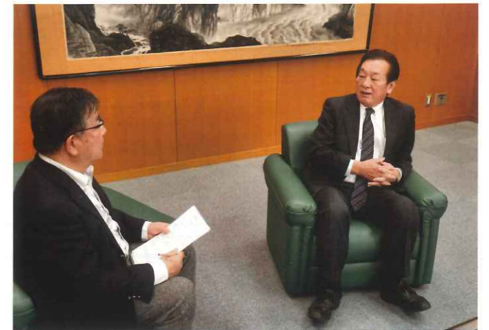
編集 / 藤本 明宏

長岡: まだまだコロナの影響は続いていますが、これからも感染予防策をしながら、お互い長崎県の文化事業を盛り上げていきましょう。この度はありがとうございました。