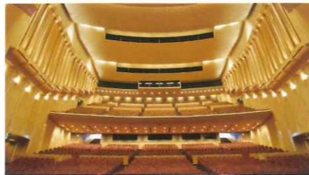
長崎ブリックホール 大ホール

1954年生まれ。佐賀県藤津郡太良町出身。早稲田大学政治経済学部経済学科卒業後、NBC長崎放送入社。放送部に所属し、アナウンサーとして17年勤務。朝のワイド番組「えびるん930」、夕方ローカルニュース「ニュース6」スポーツ実況などを担当。その後NBCラジオ局長、テレビ局長、報道局長、佐賀局長などを歴任。平成22年(株)NBCラジオ佐賀社長に就任。平成26年(株)九州広告社長を経て、平成29年7月 長崎ブリックホール館長に就任。