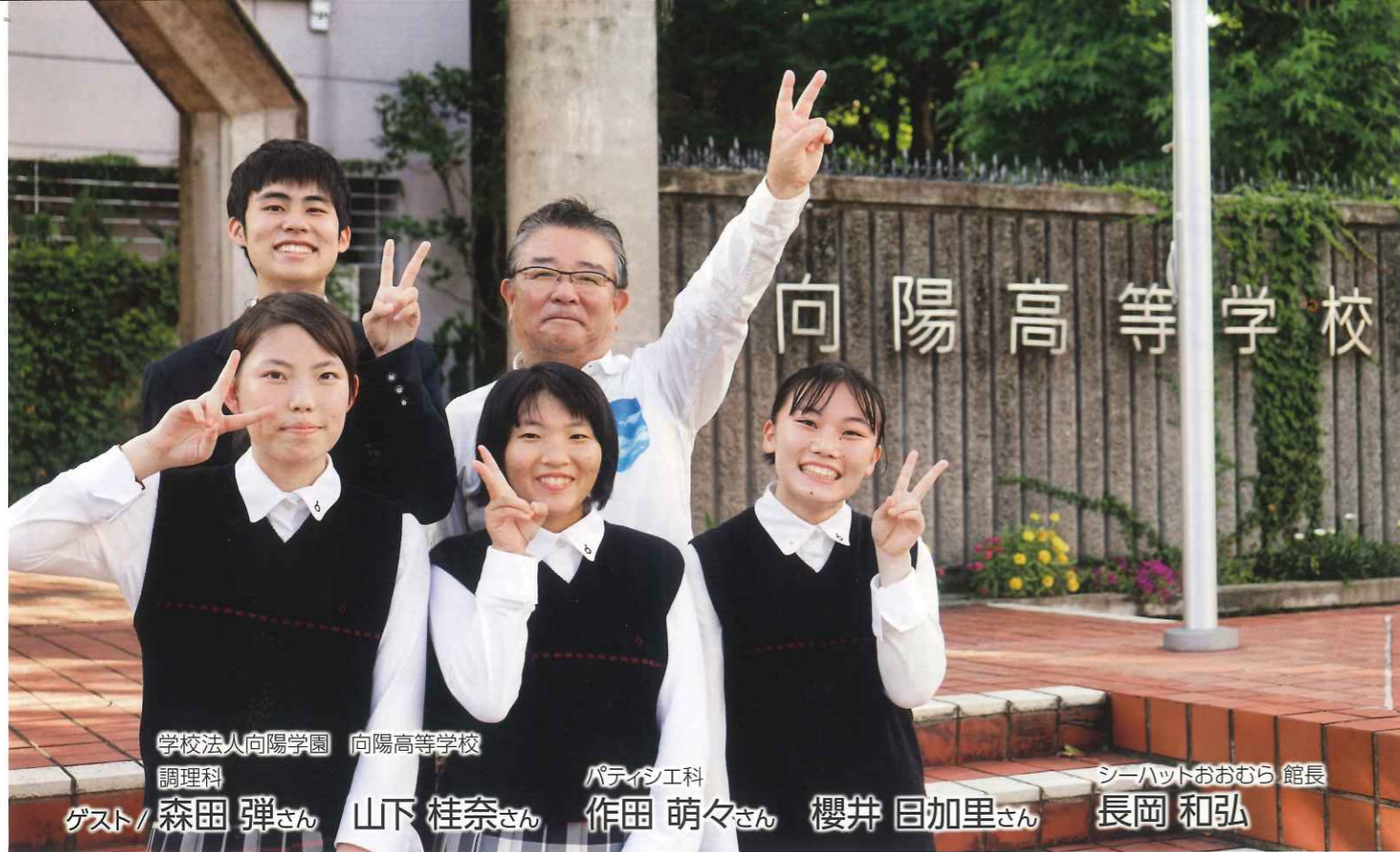
学校法人向陽学園 向陽高等学校