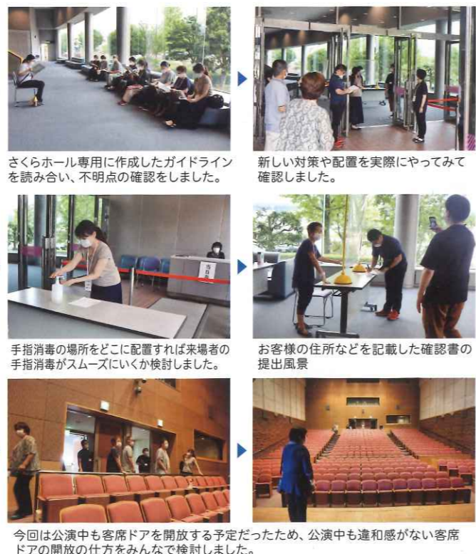
さくらホール専用で作成したガイドラインを読み合い、不明点の確認をしました。 新しい対策や配置を実際にやってみて確認しました。 手指消毒の場所をどこに配置すれば来場者の手指消毒がスムーズにいくか検討しました。 お客様の住所などを記載した確認書の提出風景 今回は公演中も客席ドアを開放する予定だったため、公演中も違和感がない客席ドアの開放の仕方をみんなで検討しました。

第24回大村寄席を開催するにあたり、新型コロナウイルス感染症対策を取りながらの運営をどうするかを確認するため、7月4日(日)にサポータークラブの皆さんと事前の予行練習をしました。大村寄席の開催は見送られましたが、今後の公演で運営するときの指針をサポーターさんと確認することができました。