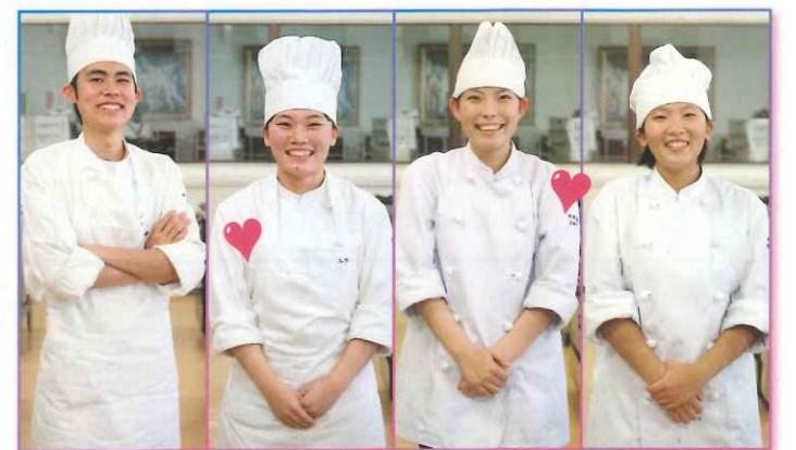
編集 / 藤本 明宏