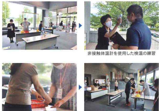
非接触体温計を使用した検温の練習 目視で行うもぎりの練習をしました。

今回の予行練習で出た問題点を改善し、皆様に安心してご来場できる会場づくりに取り組んでまいります。