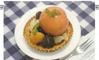
対談中にいただいた桃のスイーツ

前回の対談に続き今回は向陽高等学校での対談でした。私が東京に居る時にふとTVを見たらスイーツ甲子園という番組をやっていて、そこに向陽高校が登場して全国の代表校と競っていました。私の出身幼稚園でもあり、全力で応援しました。そして素晴らしい結果に涙した思い出があります。今回はその調理科とパティシエ科の4人の若者との対談。目の前には作ってくれた桃のスイーツが用意されていて大変楽しく美味しい対談でした。青春を調理にかけるひたむきな情熱と溢れる好奇心で輝く瞳がとっても、とっても、とっても素敵でした♡彼らが描く夢が必ず叶いますように…皆さんも応援してください！！