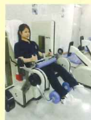
無酸素運動マシン