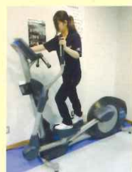
有酸素運動マシン