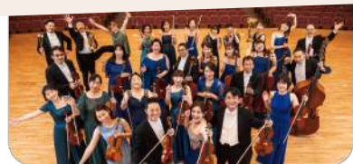
長崎 OMURA 室内合奏団 (NOCE)