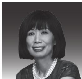
ミカ・ストルツマン (マリンバ)

リチャード・ストルツマンは、その技巧性、音楽的センス、人を惹きつけてやまない比類ない個性によって、今日最も求められる最高の演奏家の一人としての地位を確立した。数多くのオーケストラとの共演を重ねるソリストとして、魅力的なリサイタリストとして、革新的なジャズ奏者として、また、60を優に超える多作なレコーディング・アーティストとして、2度のグラミー賞受賞の栄誉に輝いているストルツマンは、様々なジャンルの批評家、聴衆から圧倒的な支持を受け続けている。彼は、ハリウッドボウルとカーネギーホールでクラリネット・リサイタルを行った最初のアーティストであり、エヴリー・フィッシャー賞を受賞した最初の管楽器奏者でもある。彼はまた、ゲイリー・パートン、チック・コリア、ジュディ・コロンス、エディ・ゴメス、ウディ・ハーマン、キース・ジャレット、メル・トーマ、そしてパイロ・ジャイラの創設者ジェレミー・ウォール等、ジャズ・ポップス界の錚々たる面々と共演、レコーディングを行っている。そして新作にも熱心に取り組み、ライヒ、武満徹、ハートキ、ラウターバー等による優れたクラリネット作品の初演を行っている。